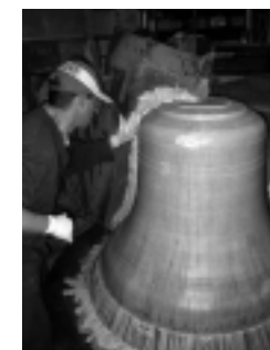
Het aanbrengen van de laag was

Als alles droog is wordt het hele bouwsel van kern, valse klok en mantel opgewarmd. Door de warmte smelt de laag was op de valse klok. Dan wordt de mantel opgetild en kan het zand en de wasresten van de valse klok worden verwijderd. Wanneer je nu de mantel weer over de kern heen plaatst, is er -waar eerst de valse klok was- een lege binnenruimte.