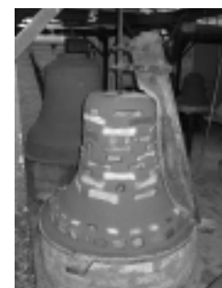
De gemetselde kern

klok en bestaat uit een laag van 10 cm natte klei die om de valse klok gesmeerd wordt. Het geheel wordt versterkt met meta-len ringen en moet dan drogen.