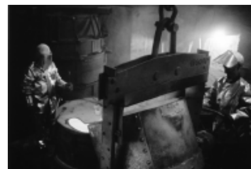
Ht gieten van de klok

Het brons, samengesteld uit 80% koper en 20% tin, wordt langzaam verhit tot ongeveer 1100 graden Celsius. Dat hete brons wordt vervolgens in de ruimte tussen de kern en de mantel gegoten. Wanneer, soms na meer dan een week, het brons is afgekoeld, haalt men de mantel weg en komt de bronzen klok te voorschijn..